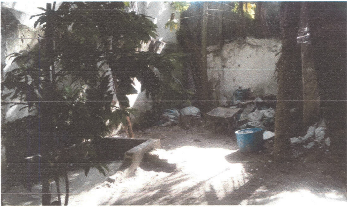
Depois da limpeza e organização do local onde estava o entulho